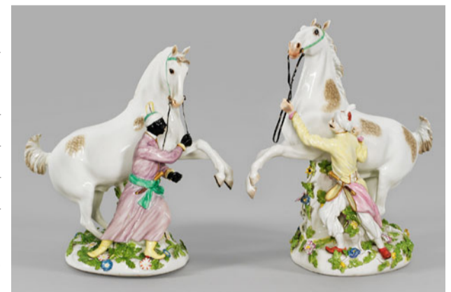
LOT 588 - ERLÖS 60.000,- €