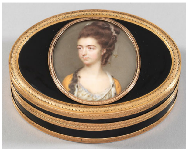
LOT 1119 - ERLÖS 18.500,- €

In der umfassenden Offerte an angewandter Kunst orientierten sich die Zuschläge meist an den Taxen. Begehrt war ein musealer, historisch bedeutender, silberner Abendmahl-Kelch mit mehreren Wappen bekannter polnischer und litauischer Adelsfamilien wie dem bedeutenden Geschlecht der Radziwills, der um 1610 geschaffen wurde. Ein baltischer Sammler steigerte ihn gegen mehrere Gegenbieter am Telefon auf 25.000,- Euro (Lot 156; Taxe 8.500,- €). Die sehr außergewöhnliche Größe von 28 x 17 cm einer circa 1730 wohl in höfischem Auftrag entstandenen Braunschweiger Barock-Dose aus Silber verlockte einen Interessenten zu einem Gebot von 23.500 Euro (Lot 146; Taxe 12.000,- €). Den höchsten Zuschlag im Porzellanangebot erzielte das kunst- und kulturhistorisch bedeutende Paar äußerst seltene Meissener Figurengruppen eines Polen in türkischem Gewand sowie eines Mohren mit „Spanischem Pferd“, für die ein Saalbieter 60.000,- Euro bewilligte (Lot 588). Unter den Einzelfiguren fand besonders die von Johann Joachim Kaendler und Peter Reinicke modellierte Statuette eines Chinesen mit Tablett aus der berühmten Meissen-Sammlung des Dresdener Bankiers Gustav von Klemperer Interesse, die 14.000,- Euro erlöste (Lot 580). Der führende englische Handel engagierte sich bei einer herausragenden Tabatiere mit signierter Bildnisminiatur (Lot 1119). Das 1776/77 aus Schildpatt mit Pariser Goldmontierung gefertigte kostbare Kleinod schmückte ein feinst gemaltes Brust-