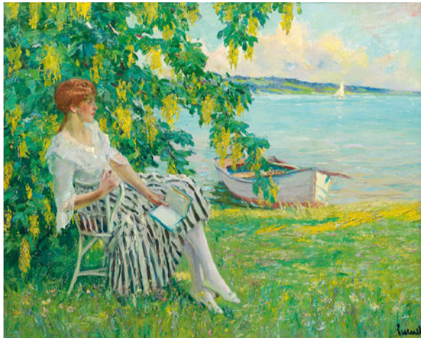
LOT 1389 - ERLÖS 118.000,- €

In der umfassenden Offerte an angewandter Kunst orientierten sich die Zuschläge meist an den Taxen. Begehrt war ein musealer, historisch bedeutender, silberner Abendmahl-Kelch mit mehreren Wappen bekannter polnischer und litauischer Adelsfamilien wie dem bedeutenden Geschlecht der Radziwills, der um 1610 geschaffen wurde. Ein baltischer Sammler steigerte ihn gegen mehrere Gegenbieter am Telefon auf 25.000,- Euro (Lot 156; Taxe 8.500,- €). Die sehr außergewöhnliche Größe von 28 x 17 cm einer circa 1730 wohl in höfischem Auftrag entstandenen Braunschweiger Barock-Dose aus Silber verlockte einen Interessenten zu einem Gebot von 23.500 Euro (Lot 146; Taxe 12.000,- €). Den höchsten Zuschlag im Porzellanangebot erzielte das kunst- und kulturhistorisch bedeutende Paar äußerst seltene Meissener Figurengruppen eines Polen in türkischem Gewand sowie eines Mohren mit „Spanischem Pferd“, für die ein Saalbieter 60.000,- Euro bewilligte (Lot 588). Unter den Einzelfiguren fand besonders die von Johann Joachim Kaendler und Peter Reinicke modellierte Statuette eines Chinesen mit Tablett aus der berühmten Meissen-Sammlung des Dresdener Bankiers Gustav von Klemperer Interesse, die 14.000,- Euro erlöste (Lot 580). Der führende englische Handel engagierte sich bei einer herausragenden Tabatiere mit signierter Bildnisminiatur (Lot 1119). Das 1776/77 aus Schildpatt mit Pariser Goldmontierung gefertigte kostbare Kleinod schmückte ein feinst gemaltes Brust-