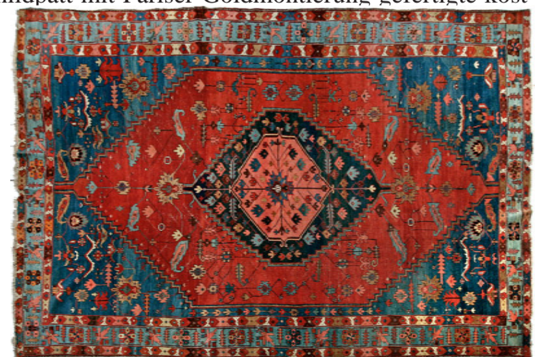
LOT 1695 - ERLÖS 15.000,- €