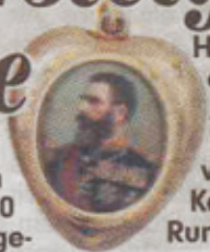
Historisch bedeutender Anhänger mit Bildnis von König Karl I. von Rumänien

Darunter zwei vergoldete Girandolen, ein Gemälde und eine Pistole aus dem Nachlass von