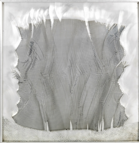
Lot 1165 - Erlös 275.000,- €