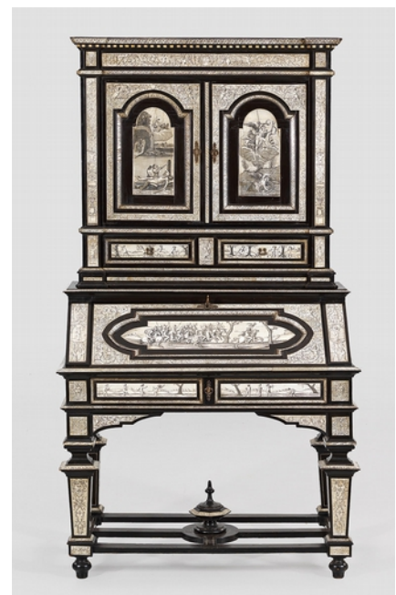
Lot 1411 - Erlös 35.000,- €

Komplett verkauft werden konnte eine umfangreiche Photographica-Kollektion mit teilweise seltenen Kameras samt Zubehör aus den 1920er bis 1980er Jahren, darunter mehrere, frühe Exemplaren der berühmten Rolleiflex, die einen Querschnitt durch diesen wichtigen Aspekt der Technik- und Kulturgeschichte bot.