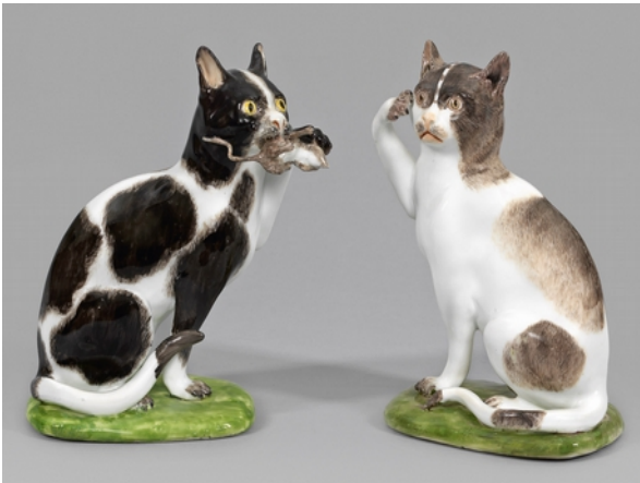
Lot 676 - Erlös 35.000,- €

Unter den älteren Gemälden bis 1900 weckte ein stimmungsvolles, motivtypisches Tafelbild von Alfred von Wierusz-Kowalski das besondere Interesse polnischer Sammler. Ab 1873 in München ansässig, wurde der Künstler vornehmlich durch inhaltlich fesselnde Darstellungen aus dem Volksleben Polens und Russlands bekannt. Sein „Troika-Schlitten in weiter Winterlandschaft“ mit virtuoser, höchst lebendiger Pferdeschilderung, wurde von 8.500,- auf 22.500 Euro gesteigert (Lot 1069). Ein monumentales Hauptwerk Otto Heydens aus dem Besitz Kaiser Friedrich III. - "Das Eingreifen der II. Armee in die Schlacht von Königgrätz", das 1870 im Auftrag des Kronprinzen entstand und diesen als Feldherr mit seinem Generalstab zeigt, konnte für 47.500,- €uro an ein großes historisches Museum vermittelt werden (Lot 1053).