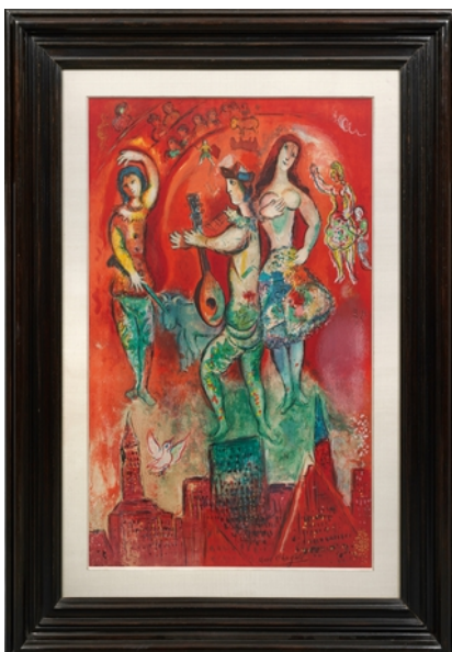
Lot 476 - Erlös 46.500,- €

Auch auf dem Gebiet der Grafik ragten Blätter der Klassischen Moderne und zeitgenössischer Künstler wie Marc Chagall, Roy Lichtenstein und Andy Warhol heraus. Chagall war mit drei seiner schönsten, in kleinen Auflagen erschienenen Farblithographien vertreten, darunter das großformatige, farbenprächtige Blatt „Carmen“ von 1967, das 46.500,- Euro erlöste (Lot 476). Eine Ikone der Pop Art ist Lichtensteins "Shipboard Girl", das 1965 von der Leo Castelli Gallery in New York herausgegeben wurde; ein farbfrischer Abzug des begehrten Blatts sicherte sich für 23.500,- Euro ein deutscher Sammler (Lot 497; Taxe 12.500,- Euro).